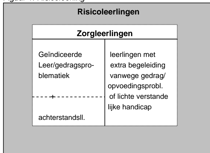
Figuur 1: Risicoleerling

Zorgleerlingen kunnen worden gedefinieerd als leerlingen die extra zorg en ondersteuning nodig hebben om het onderwijs met succes te kunnen volgen en afronden (SCP, 2002). Hierbij wordt weer nader onderscheid gemaakt tussen twee groepen leerlingen, namelijk: leerlingen met geïndiceerde leer- en/of gedragsproblemen, waaronder leerlingen, die met achterstanden kampen vanwege hun sociale of culturele