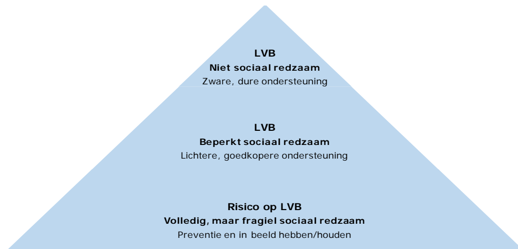
Figuur 2.2 De sociale redzaamheidspiramide

niveau van een LVB functioneren, en dus (tijdelijk) lichte of zware ondersteuning nodig hebben. Zij zitten dan (tijdelijk) hoger in de piramide.